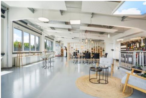
Etoy (VD), En Courta Rama