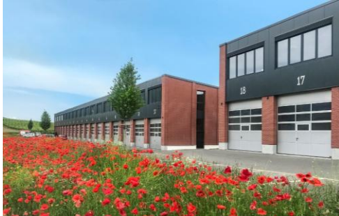
Champagne (VD), Chemin de Praz