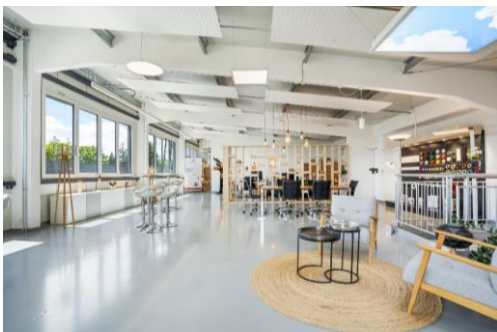
Etoy (VD), En Courta Rama