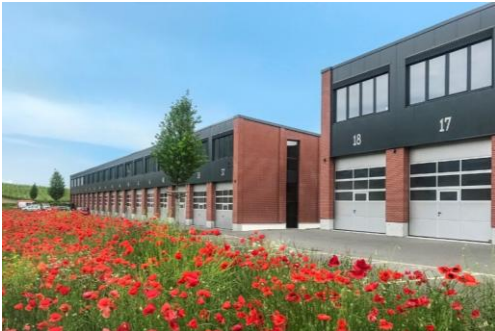
Champagne (VD), Chemin de Praz