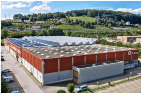
Puidoux (VD), ZI de Verney 4