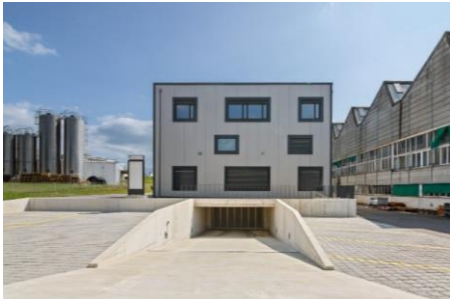
Préverenges (VD), Rue du Vuasset 4,6,8