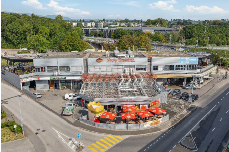
Morges (VD), Avenue Riond-Bosson 2