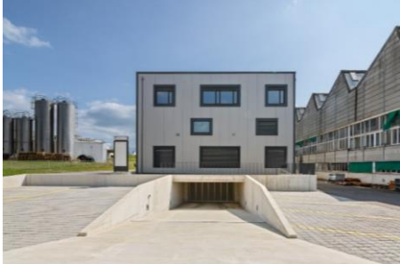
Préverenges (VD), Rue du Vuasset 4,6,8