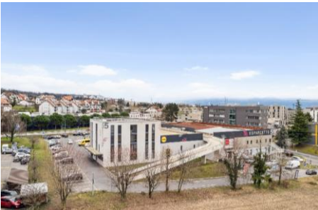
Crissier (VD), Chemin de l'Esparcette 5