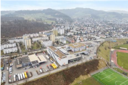
Pratteln (BL), Rütliweg 5-13