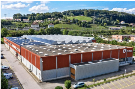
Puidoux (VD), ZI de Verney 4