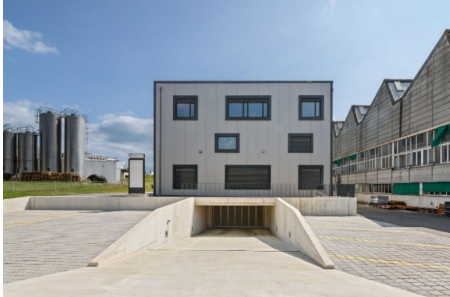
Prévèrenge (VD), Rue du Vuasset 4,6,8