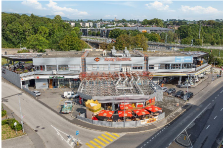
Morges (VD), Avenue Riond-Bosson 2