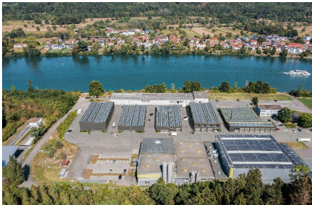
Wallbach (AG), Rheinstrasse 74