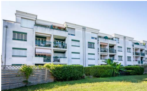
Meyrin (GE), Chemin de la Tour 4,6,8