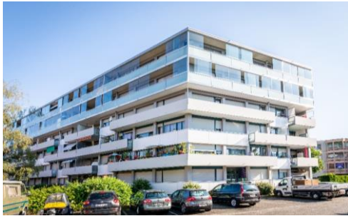
Vernier (GE), Avenue Louis-Pictet 1010B