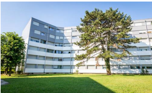
Vernier (GE), Avenue Louis-Pictet 10-10B