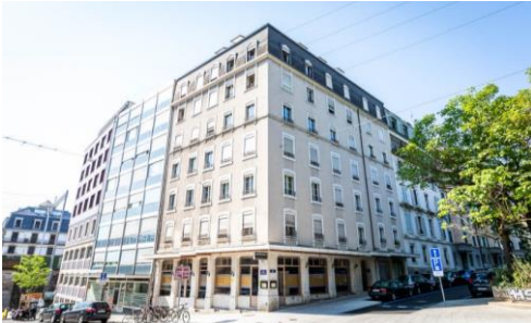
Genf (GE), Rue Voltaire 11 / Vuache 1