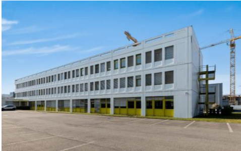
Meyrin (GE), Rue du Prè-de-Fontaine 8,19