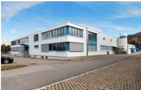
Châtel-St.Denis (FR), Route de Plan 3