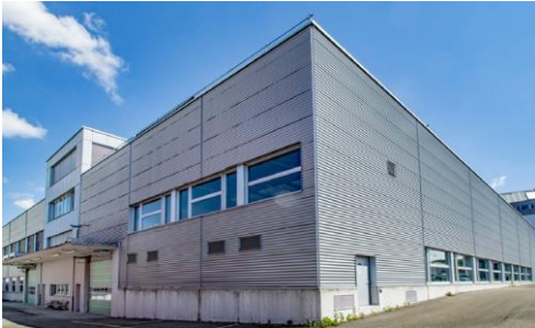
Muri (AG), Pilatusstrasse