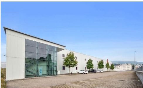
Küsnacht (SZ), Zugerstrasse 55