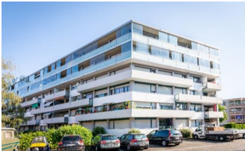
Vernier (GE), Avenue Louis-Pictet 1010B