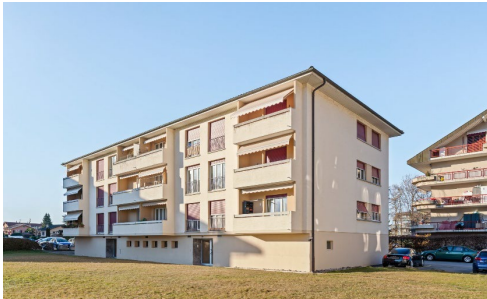
Villeneuve (VD), Route de Praz-Berard 28-30