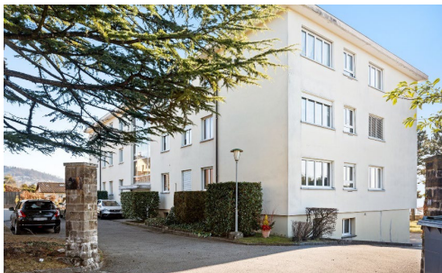
Lutry (VD), Route de Corsy 5